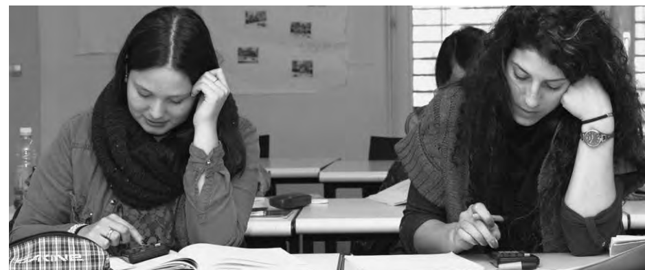
Mit Weiterbildung zum Erfolg: Der Lehrgang Handelsschule edupool.ch wird immer beliebter.

Mein Dank geht an alle, die mithelfen, den Berufslernenden stabile Brücken in die Berufswelt und den Studierenden der Weiterbildung und der Höheren Fachschule für Wirtschaft Karriereleitern zu bauen. Jede und jeder vor und hinter den Kulissen ist wichtig und trägt seinen Teil dazu bei, dass unsere Lernenden am Ende der Ausbildung stolz auf der Bühne stehen und ihr Diplom entgegennehmen. ■