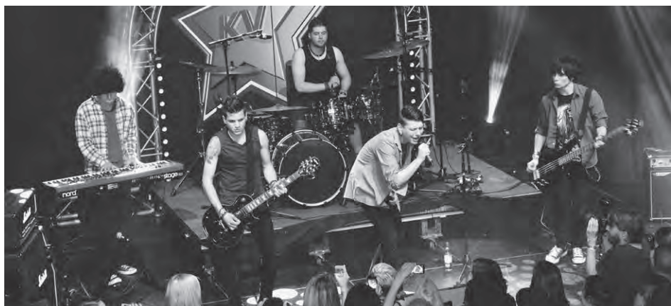
Die Band «Instead of Butterflies» errockte sich in der Kammgarn die Silbermedaille.