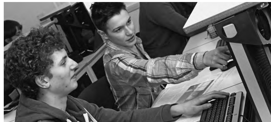
Breite Ausbildung mit Berufsmaturität: Den Mediamatikern stehen viele Wege offen.

Zu den innovativsten Ausbildungen gehört die Mediamatiker-Lehre. Mediamatiker verfügen über Wissen in Multimedia, Design, Marketing, Informatik und Administration. Sie gestalten und pflegen Websites und Intranet, fertigen Präsentationen und Dokumentationen an und betreuen Veranstaltungen. Sie aktualisieren zum Beispiel die Website von Unternehmen mit Bildern, Filmen, Musik und Sprache, wobei sie diese auch selber aufnehmen und aufbereiten. Sie wirken auch im Informatik-Support mit und sind in der Administration tätig. Dank ihrer breiten Ausbildung mit integrierter kaufmännischer Berufsmaturität, ihrer Kreativität und ihren Sprachkenntnissen in Deutsch, Englisch und einer weiteren Landessprache finden sie Stellen in allen Wirtschaftszweigen oder schlagen häufig eine akademische Karriere mit Hochschulstudium ein. ■