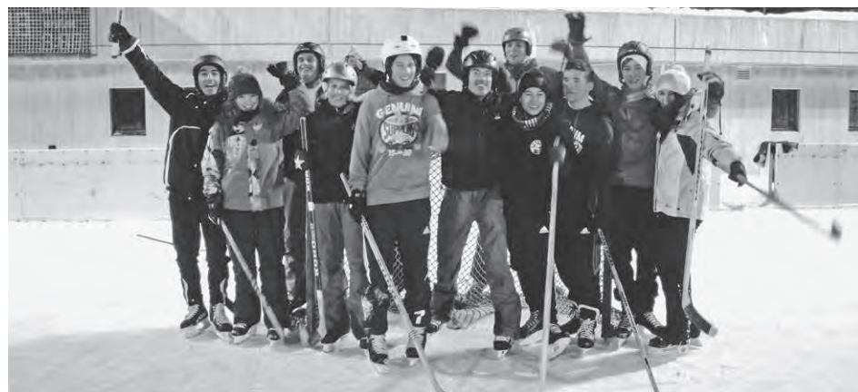
Viel Spass beim traditionellen Hockeymatch gegen das Leiterteam.