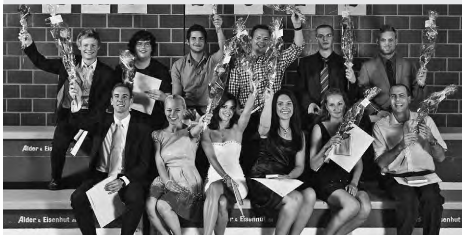
Die Spitzenkandidaten aller Abteilungen haben doppelten Grund zum Jubeln.