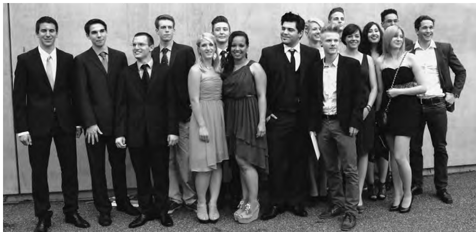
100% Erfolgsquote bei der Berufsmaturitätsprüfung: Die erfolgreiche Klasse HMS 8.

Das Jahr 2012 wurde für die Umsetzung des Reglements 2010 genutzt. So wurden weitere problemorientierte Unterrichtssequenzen entwickelt. Die Schulleitung hat sich mit der Umsetzung der IPT (Integrierte Praxisteile) befasst und formulierte ein neues Prüfungs-