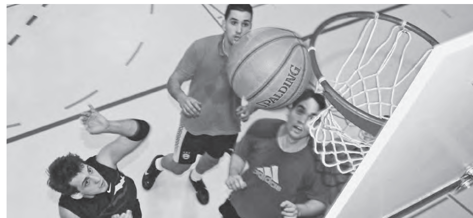
Erstmals an den HKV-Meisterschaften wurde auch um Basketball-Ehren gekämpft.

Sportarten konnte es zwar seine Routine ausspielen, siegte aber jeweils äusserst knapp. Das Basketballturnier entschied die Klasse KBM IIa für sich. Erfreulich war, dass sich ausser ein paar kleineren Blessuren keine Teilnehmenden verletzt haben und dass wohl die allermeisten gut gelaunt das Turnier beendet haben. ■