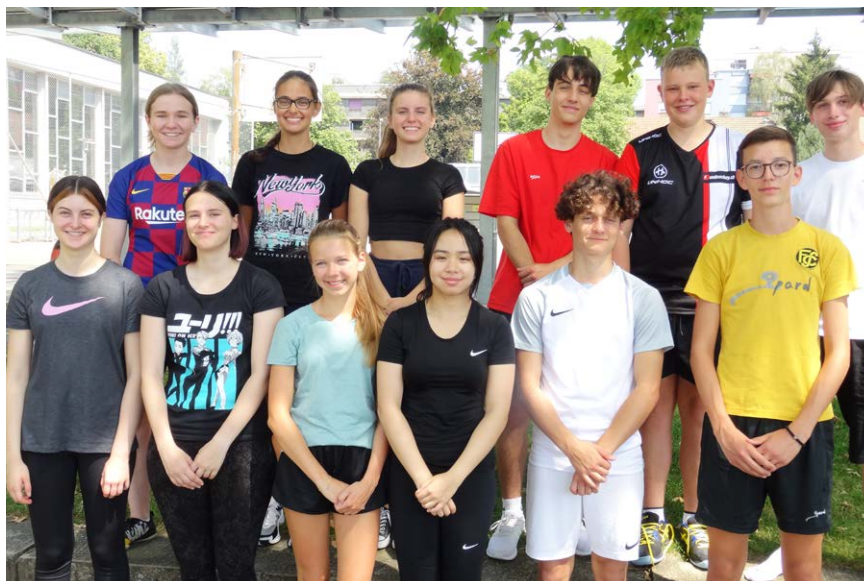
In den Startlöchern: Die neue Mediamatiker-Klasse MED 20–24.

Im Sommer 2020 absolvierte die Mehrheit der Handelsmittelschüler des zweiten Semesters ihr fünfwöchiges Praktikum in regionalen Betrieben. Sie bekamen so erste Einblicke in den Büroalltag und konnten das erworbene Theoriewissen erstmals in der Praxis anwenden und sich so für die weitere