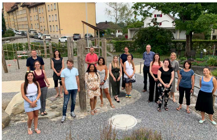
Abschlussanlass Sachbearbeiter Rechnungswesen

Eine Teilnehmerumfrage im Juni zeigte, dass die Dozenten während des Lockdowns einen guten Job gemacht haben. In Zusatzschichten wurde Fernlernen erworben und ohne Vorlaufzeit angewendet. Agilität war in dieser Zeit sehr gefragt: Prüfungen und Ter-