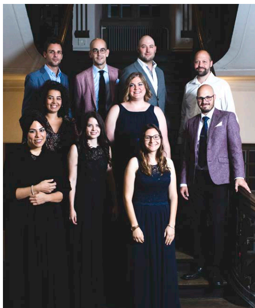
Die zehn «High Flyers and Winners»

Auch die HFW blieb von Corona nicht verschont. Vom einen auf den anderen Tag mussten wir im März 2020 vom Präsenz- auf den Fernunterricht wechseln. Das war für alle ungewohnt. Dozenten und Studierende zeigten sich aber flexibel, sodass sich nach einigen Anfangsschwierigkeiten ein geordneter Unterricht einstellte. Mit einer Um-