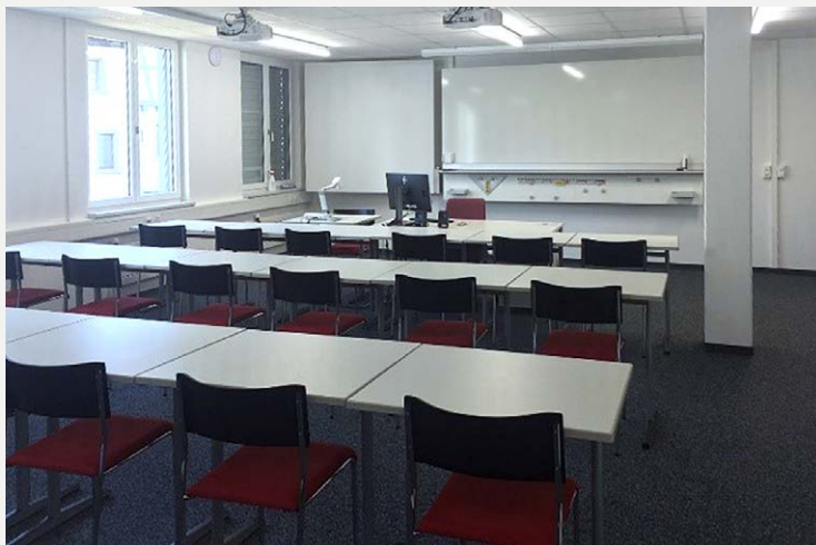
Neue Räumlichkeiten an der Moserstrasse 25

Und zuletzt noch dies: Die Arbeiten rund um die Potenzialbeurteilung hinsichtlich einer möglichen Integration der HKV Handelsschule KV Schaffhausen in die Berufsfachschule BBZ Schaffhausen haben im vergangenen Jahr begonnen. Der Prozess verläuft bis jetzt in geordneten Bahnen, konstruktiv und mit gegenseitiger Wertschätzung unter allen Beteiligten. Für eine Einschätzung mit Blick auf ein mögliches Ergebnis ist es noch zu früh. Nach meinem Empfinden bewegen wir uns aber in einem konsensorientierten Klima.