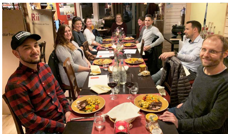
Abschlussanlass Sachbearbeiter Immobilien

Das Zitat «Nichts ist so beständig wie der Wandel» bekam seine Gültigkeit anfangs November. Aufgrund der Corona-Situation wurde der Präsenzunterricht an der Weiterbildungsabteilung erneut verboten und so galt es, die letzten Monate des Jahres im Fernunterricht zu gestalten. Dank dem erworbenen Knowhow, der neuen technischen Hilfsmittel und der Anpassungsbereitschaft der Dozenten und Teilnehmenden konnte diese Umstellung schnell und zufriedenstellend gemacht werden. ■